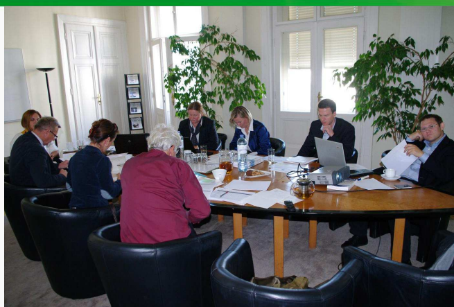
Pracovné stretnutie k projektu PUMAKO; Hill AMC GmbH