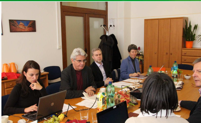
Druhé pracovné stretnutie k projektu PUMAKO ; VŠEMvs v Bratislave, 26. januára 2011