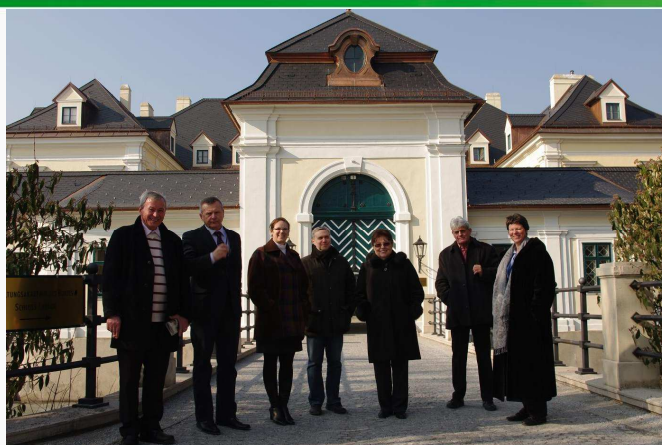
Pracovné stretnutie k projektu PUMAKO; FH Campus Viedeň- Schloss Laudon