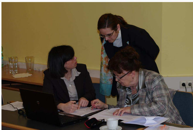
Pracovné stretnutie k projektu PUMAKO; FH Campus Viedeň, Schloss Laudon